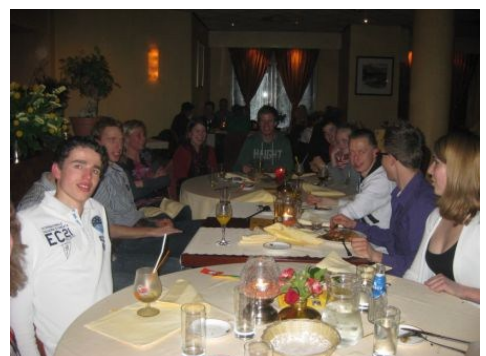
Het HRTT bij de wok

het nieuwe jaar in te luiden met een avondje wokken. Het werd een gezellige avond met lekker eten!