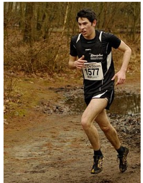
Jaro in actie tijdens de Mastboscross Breda

leverde hem dit een tiende plaats op. Koen stond zelfverzekerd klaar voor de 9,9 km lange wedstrijd. Vooraf gaf hij al te kennen voor de winst te zullen gaan. De snel gevormde kopgroep, waarvan Koen deel uitmaakte, viel snel uiteen, waarna Koen met één concurrent overbleef. Koen straalde zelfvertrouwen en zelfbeheersing uit. In de laatste omloop was een versnelling van hem z'n concurrent te machtig. Hij wist dan ook uiteindelijk met een ruime voorsprong als winnaar de streep te passeren in een officieuze tijd van 32.23!